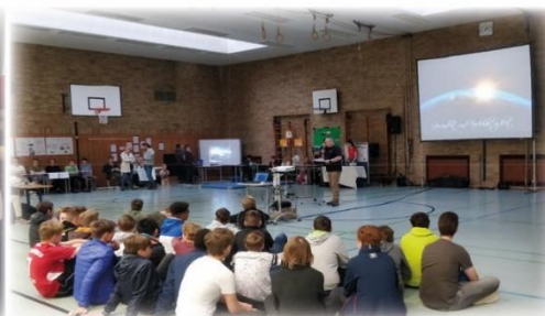
Veranstaltungen und schulische Projekte

Wir freuen uns darauf, Sie kennenzulernen!