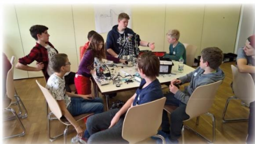
Internationale Projekte und MINT-Förderung

Schulübergreifende Aktivitäten im kulturellen, sportlichen und sozialen Bereich Klassenfahrten und Austauschprojekte MINT-Förderung und internationalen Austausch Projekte zur Verbesserung der Lernsituation Modernisierung des Unterrichts Projekte zur Verschönerung der Schule Pausenprojekt „Gesundes Frühstück“